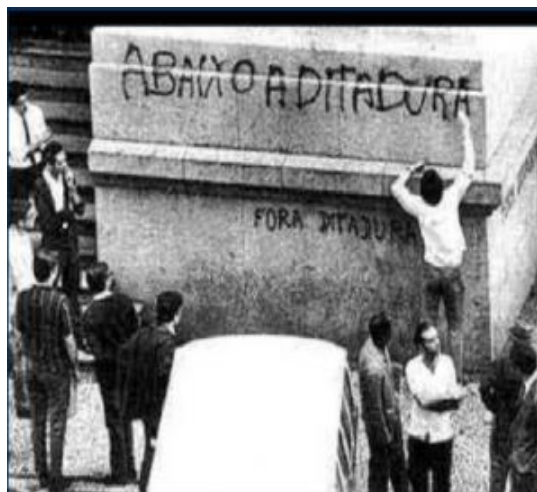
Figura 1: A radicalização política. O processo de radicalização política foi acelerado com a violenta repressão contra as manifestações estudantis que pediam o retorno à democracia e o fim do aparato autoritário e repressor implantado pelos golpistas 2 .

Com o golpe de 1964, os militares passaram a exercer controle total sobre a produção acadêmica e cultural no país. A censura prévia aos jornais e às outras mídias, bem como os intensos confrontos entre militares e estudantes, criaram um clima de animosidade crescente. Contribuíram para isso a profunda radicalização do movimento estudantil (mobilizado e atuante desde o governo de Goulart) e a insatisfação da classe política de oposição (Fig. 1).