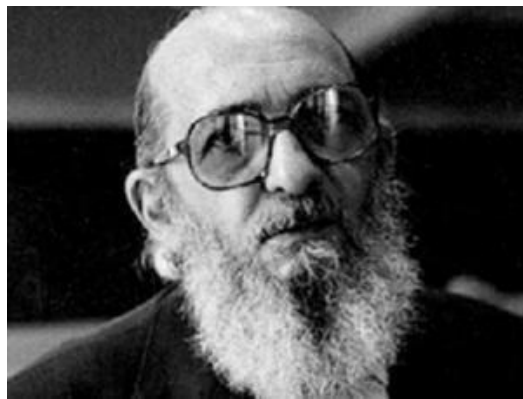
Figura 2: Paulo Freire concebeu um revolucionário método de alfabetização a partir da formação da consciência política, mas teve que se exilar em função da perseguição dos militares 3 .

A manutenção do status quo do regime autoritário requeria controle total e absoluto da sociedade, e os cientistas que não concordavam com as escolhas feitas pelos militares passaram a ser perseguidos. Alguns foram presos ou aposentados compulsoriamente; outros preferiram o exílio (Fig. 2).