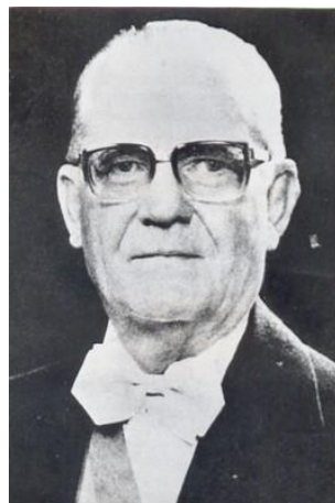
Figura 4: Ernesto Geisel (1907 - 1996), penúltimo presidente do regime militar 8 .

Geisel recebeu a Presidência das mãos de Médici em março de 1974 (com mandato previsto até março de 1979) e, junto com ela, a herança do fim do “milagre” brasileiro e das taxas de crescimento elevadas. O penúltimo presidente militar assumiu o principal posto do governo brasileiro com preocupações bem diferentes das de seus antecessores, chamando para si as tarefas de reconduzir o país à democracia – dado o esgotamento da ditadura militar e das pressões da sociedade civil –, sem perder, no entanto, o direito do controle do processo. Geisel tinha uma difícil tarefa pela frente: impedir a ação de setores linha-dura dos militares e o acirramento das ações consideradas subversivas; manter as altas taxas de crescimento econômico; e procurar resolver as desigualdades resultantes de uma distribuição de renda injusta (Fig. 4).