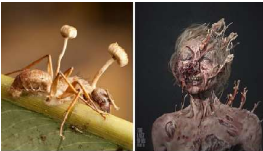
Figura 07: Roteiro, conceito e arte em The Last of Us baseados em teoria da evolução e pandemia por fungo cordyceps .