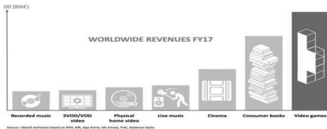
Figura 01: Crescente indústria dos videogames demanda compreendê-la para não correremos riscos de construirmos uma escola distante da realidade de nossas e nossos estudantes.