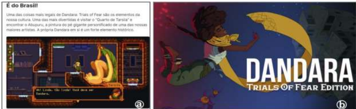
Figura 04: Dandara traz elementos étnico-raciais e da cultura brasileira, neste caso referência ao modernismo e a Tarsila do Amaral na imagem da esquerda (a).