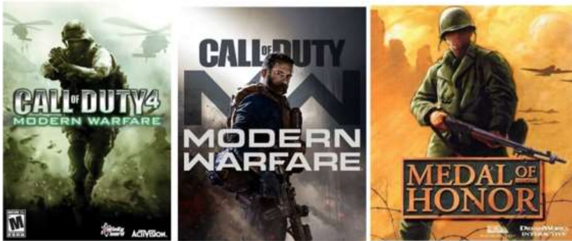
Figura 08: Call of Duty é um dos mais consagrados jogos de guerra de todos os tempos e é foco da pesquisa no que tange a vinculação com disciplinas das ciências humanas e sociais. Em Medal of Honor , série iniciada no ano de 1999 e desenvolvido pela DreamWorks Interactive com a história do cineasta Steven Spielberg.

alcançam adaptações até mesmo para smartphones e plataformas portáteis (Figura 08). Discussões geopolíticas são emergentes nos jogos do COD e Medal of Honor