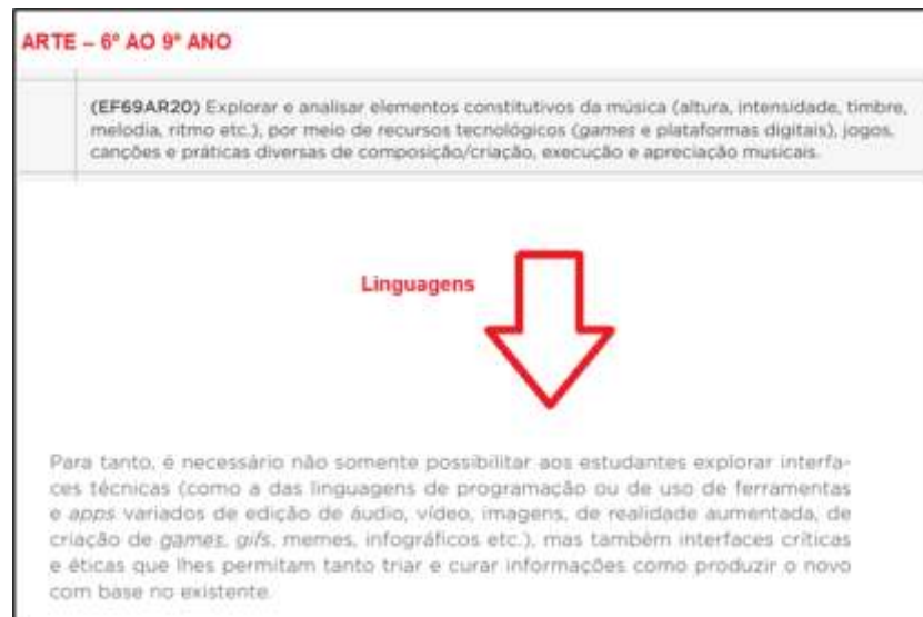
Figura 03: Exemplos identificados de referências aos videogames ao longo da BNCC.