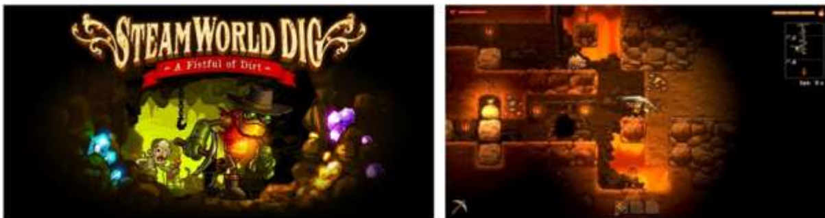
Figura 06: SteamWorld Dig e sua coleção de minerais e gemas na mais controversa aventura.