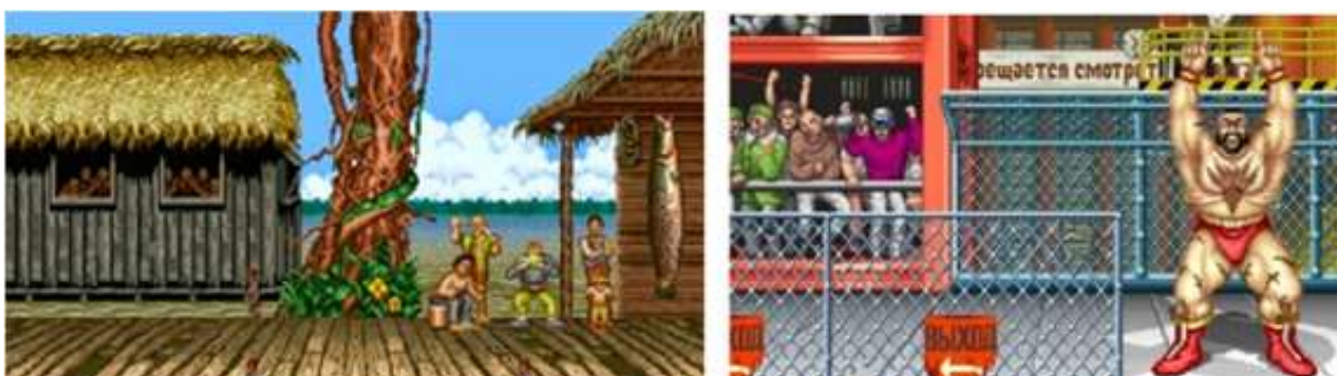
Figura 09: O jogo Street Fighter II , para diversos consoles, é um dos melhores jogos antigos de luta para tratar a representação de Estado-nações no contexto da Guerra Fria. A esquerda o selvagem Brasil e a direita a industrializada e pesada URSS.

Paisagens e personagens criam significados comuns de países e regiões