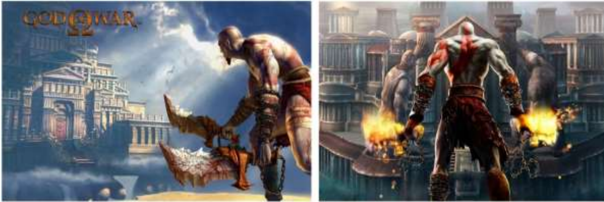
Figura 10: God of War é um jogo de ação-aventura, criado por David Jaffe e baseado na mitologia grega.

God of War , história e filosofia são centrais no roteiro do jogo